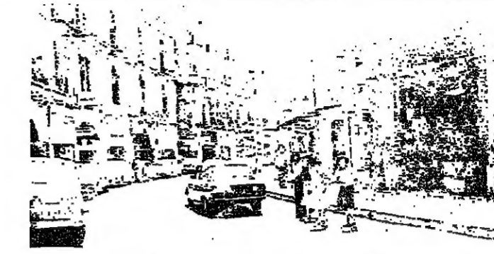
العودة من الجبال الى بيروت ( تصوير حكيم حبرا )